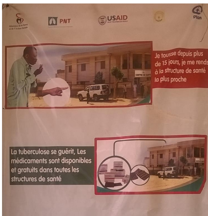
Figure 1: Affiche de sensibilisation sur la tuberculose au Centre de santé de Diofior, 2015.

Les objectifs de cette caravane étaient :